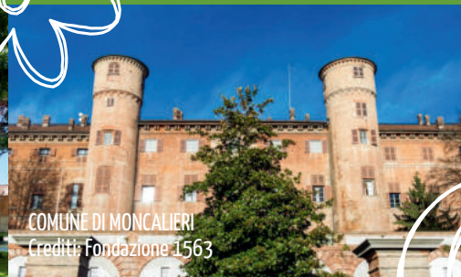
COMUNE DI MONCALIERI Crediti: Fondazione 1563