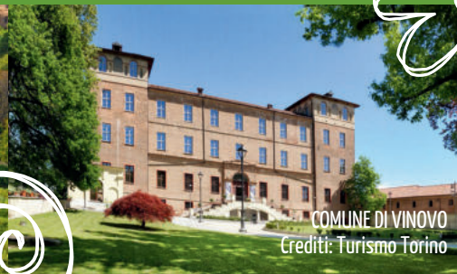
COMUNE DI VINOVO