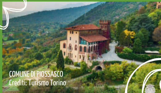
COMUNE DI PIOSSASCO

UN NUOVO APPROCCIO ALL'ECONOMIA CIRCOLARE, PER RENDERE ANCORA PIÙ BELLE E PULITE LE NOSTRE CITTÀ!