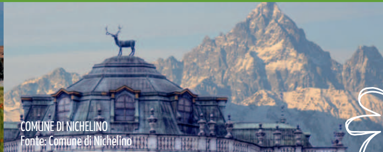
COMUNE DI NICHELINO