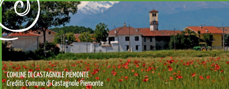
COMUNE DI CASTAGNOLE PIEMONTE