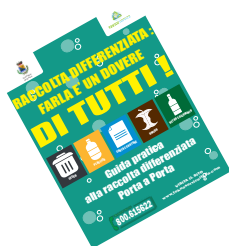
Guida alla Raccolta