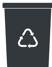
Mastello 40l SECCO