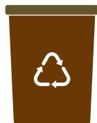
Mastello 30l UMIDO