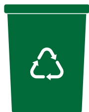
Mastello 40l VETRO