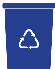
Mastello 40l CARTA