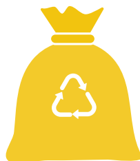
Sacco per PLASTICA